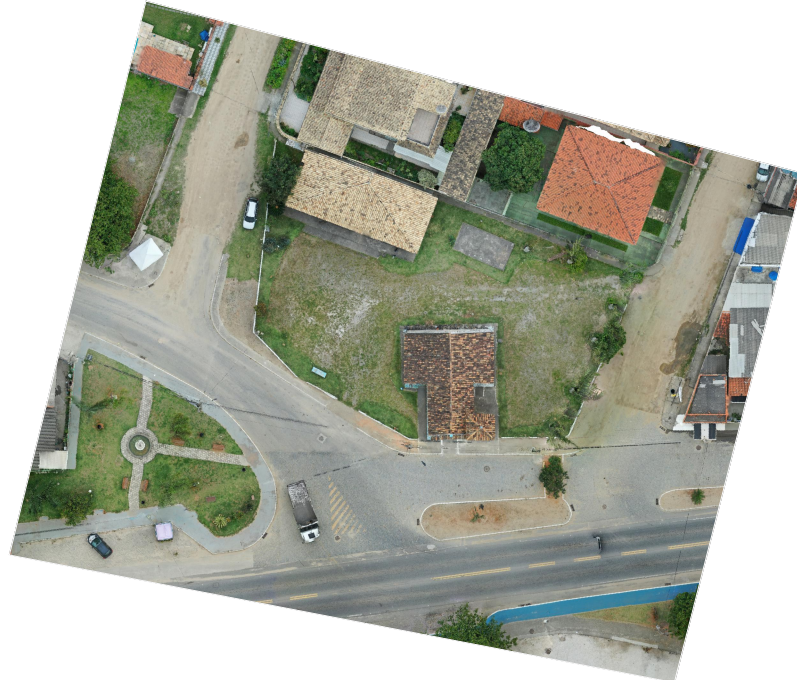
ORTOFOTO DE LOCALIZAÇÃO ESCALA 1 : 1000